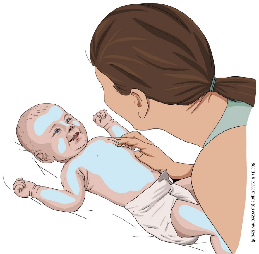
Beeld uit eczeemgids (op eczeemwijzer.nl).

Het Zorginstituut liet onderzoeksbureau Ecorys onderzoek doen naar voorlichting en