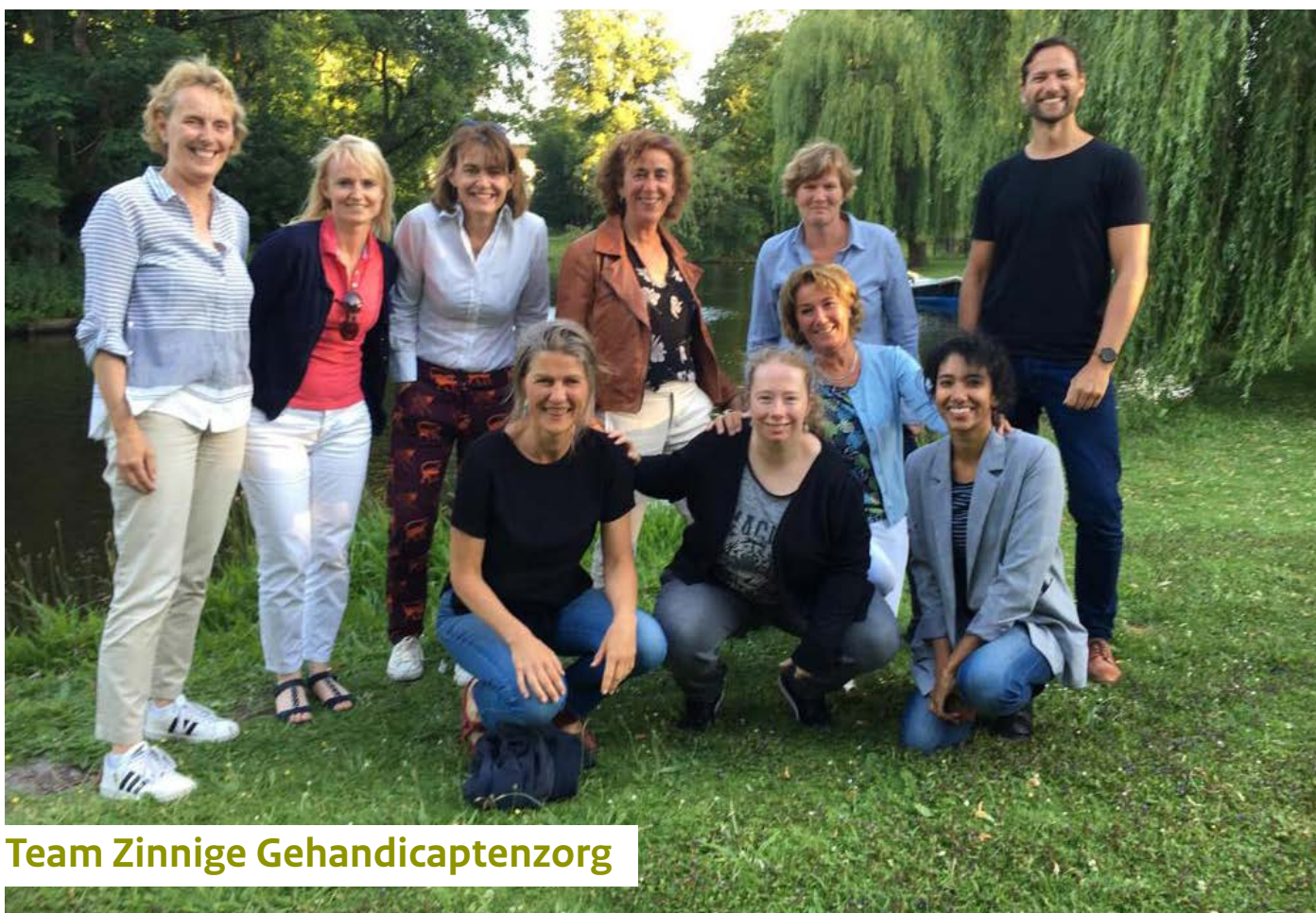
Team Zinnige Gehandicaptenzorg

Lees het hele artikel in het e-zine 'Zinnige Zorg , op zoek naar wat beter kan'.